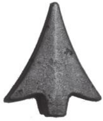
Referencia Medida 01.040.084 12x70