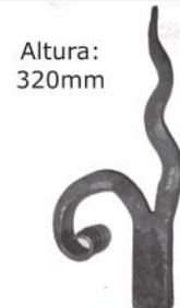
Ref. Medida 01.040.144 30x30 01.040.146 40x40