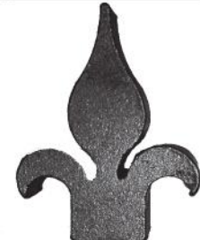
Referencia 01.040.182 Medida 40x40 140