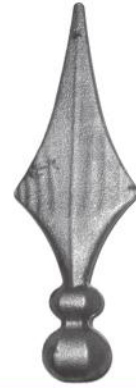
Referencia Medida 01.040.090 35x200