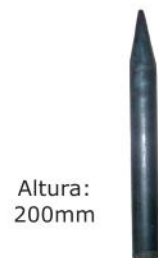
Ref. Medida 01.040.150 Ø 12 01.040.152 Ø 14 01.040.154 Ø 16 01.040.158 Ø 30