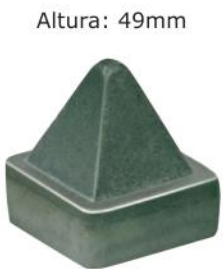
Ref. Medida 01.040.124 42x42